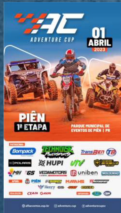
INSTAGRAM / FACEBOOK STORIES