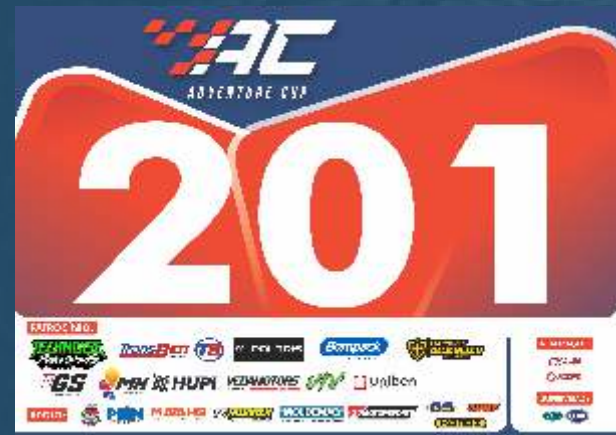
NÚMERAIIS UTV 28X20 CM