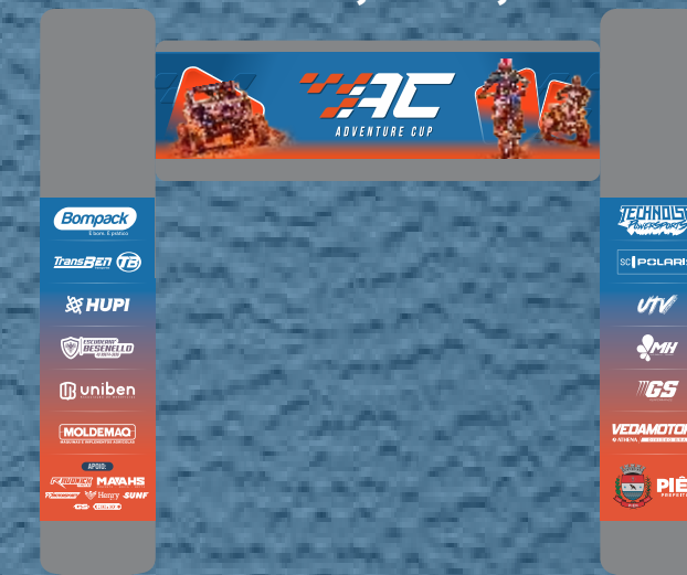
INFLÁVEL 4,40 X 3,30 M