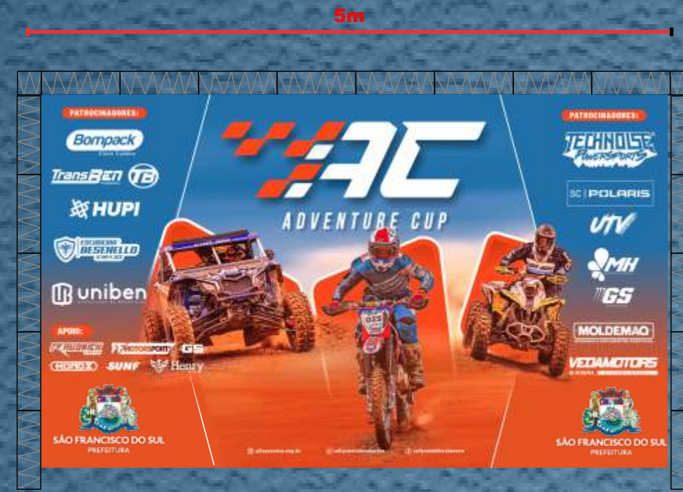
PAINEL DE LED 5X3M