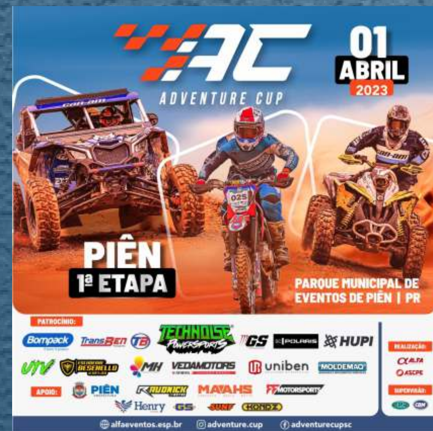
INSTAGRAM / FACEBOOK FEED