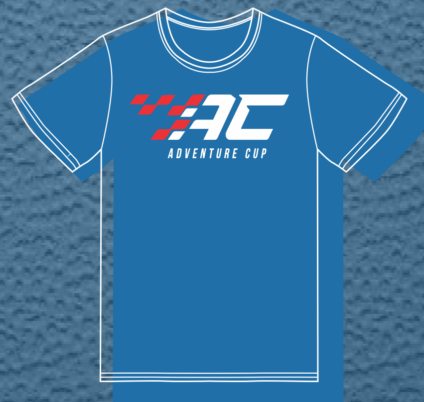
300 CAMISETAS PERSONALISADAS