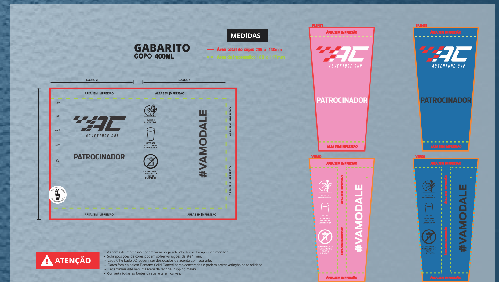
500 ECO COPOS