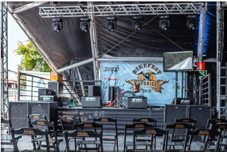
Palco e Som