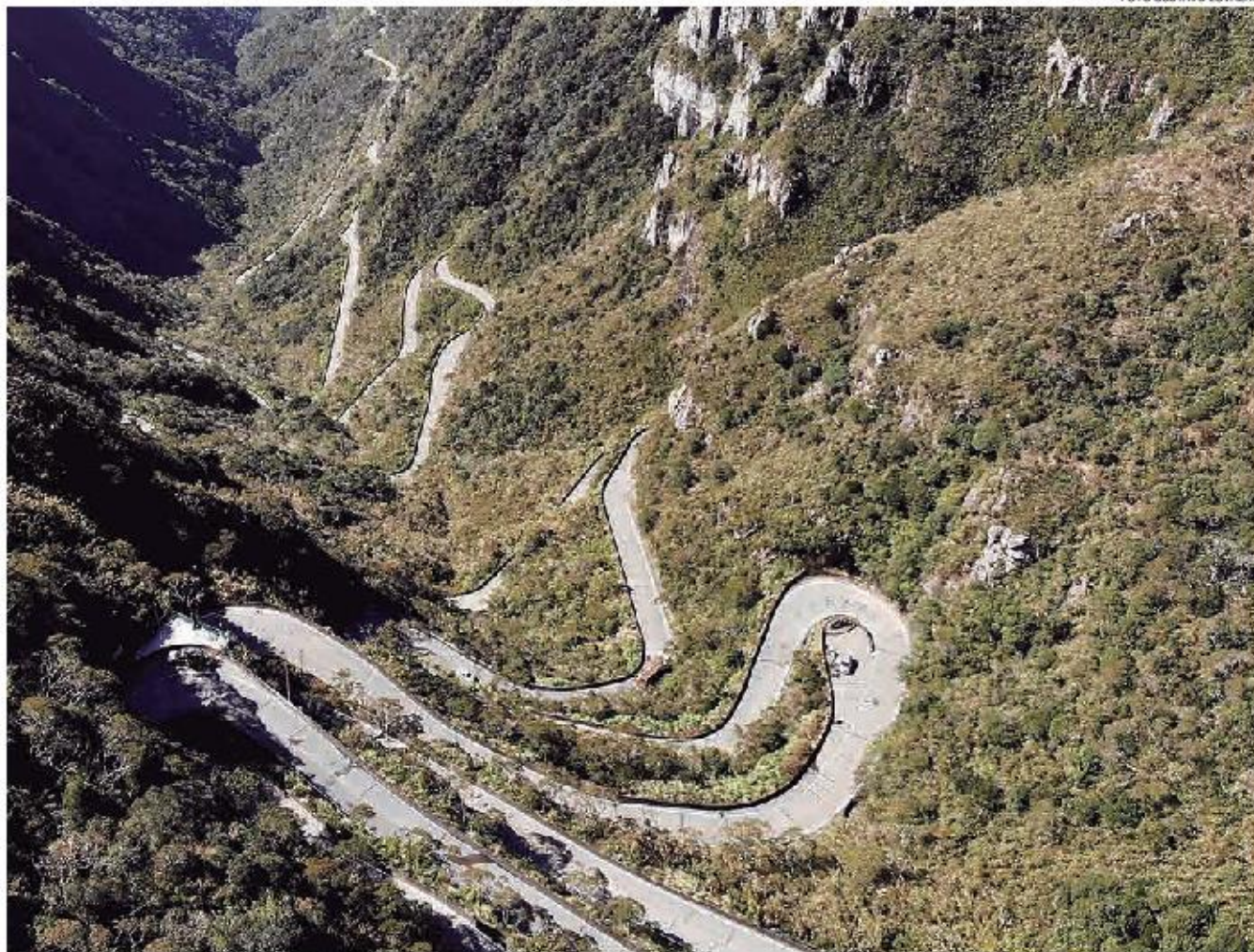
Serra do Rastro, um dos locais mais procurados por motociclistas, que também faz parte da programação do Bike Fest Urubici

ENCONTRO. Turma das duas rodas de Minas - e de todo o País - se prepara para a primeira edição do Bike Fest em Urubici, em uma das regiões mais belas de Santa Catarina. p. 30